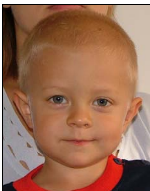
w tle widoczna inna osoba