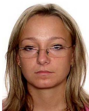
oprawka zasłania oczy