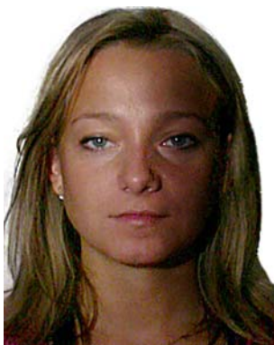
cień na twarzy