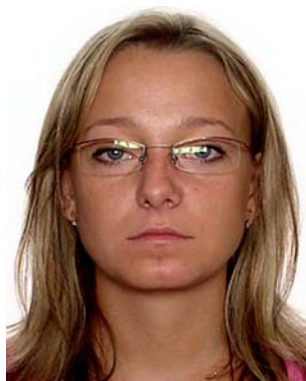
refleksy w okularach