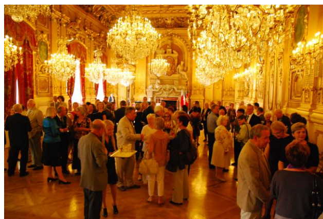
Salon de l'Hôtel de Ville